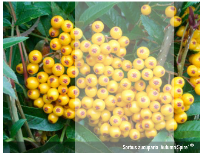
Sorbus aucuparia 'Autumn Spire'®