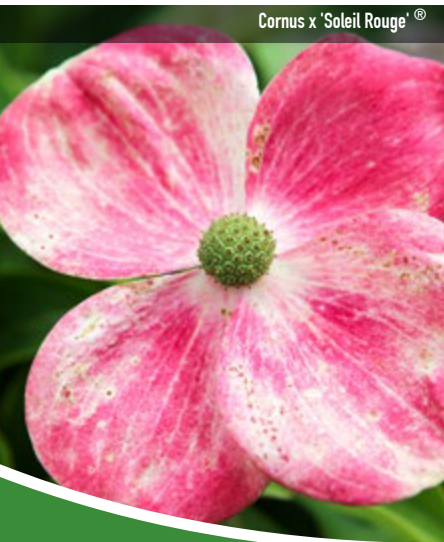
Cornus x 'Soleil Rouge'®