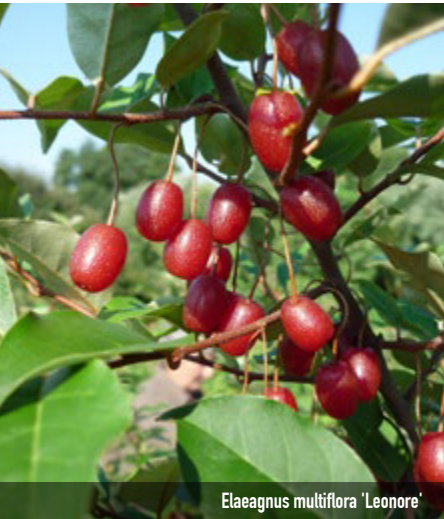
Elaeagnus multiflora 'Leonore'