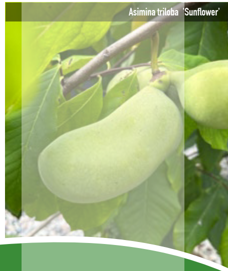
Asimina triloba 'Sunflower'

Vielfalt aus Schleswig-Holstein seit 1912