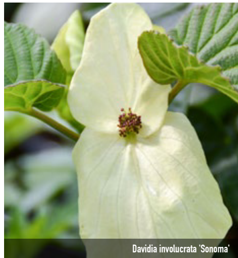
Davidia involucrata 'Sonoma'