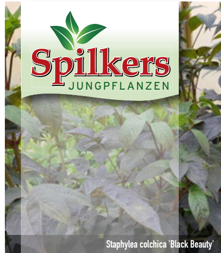
Staphylea colchica 'Black Beauty'