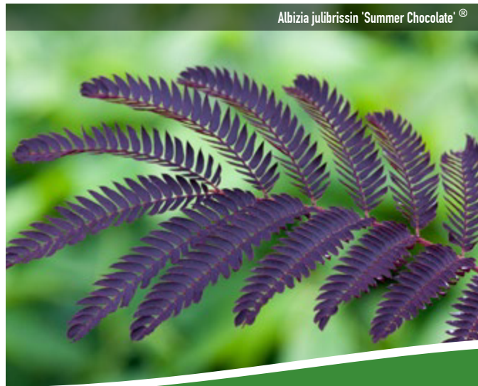
Albizia julibrissin 'Summer Chocolate'®