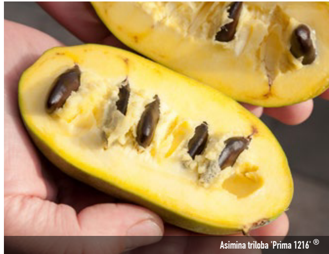
Asimina triloba 'Prima 1216'®